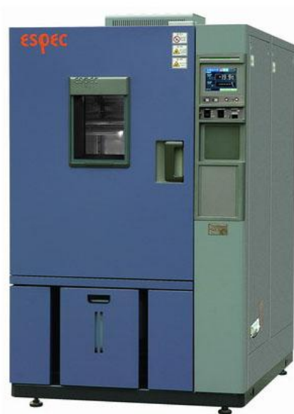
图 1 高低温交变湿热试验箱

ESL-02KA/ESL-04KA 型高低温交变（湿热）试验箱的外观，如图 1 所示。