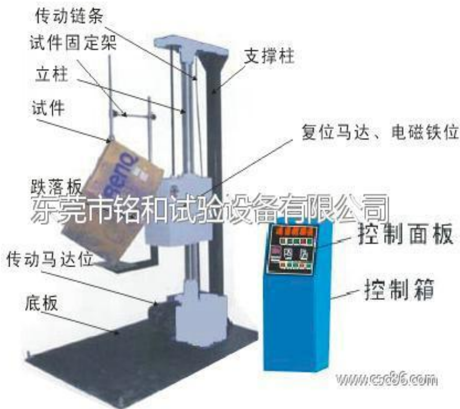
图 3 跌落试验机