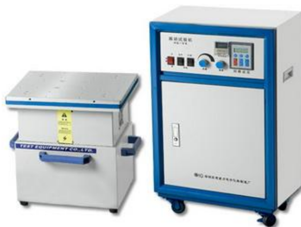
图 2 电磁式振动试验台