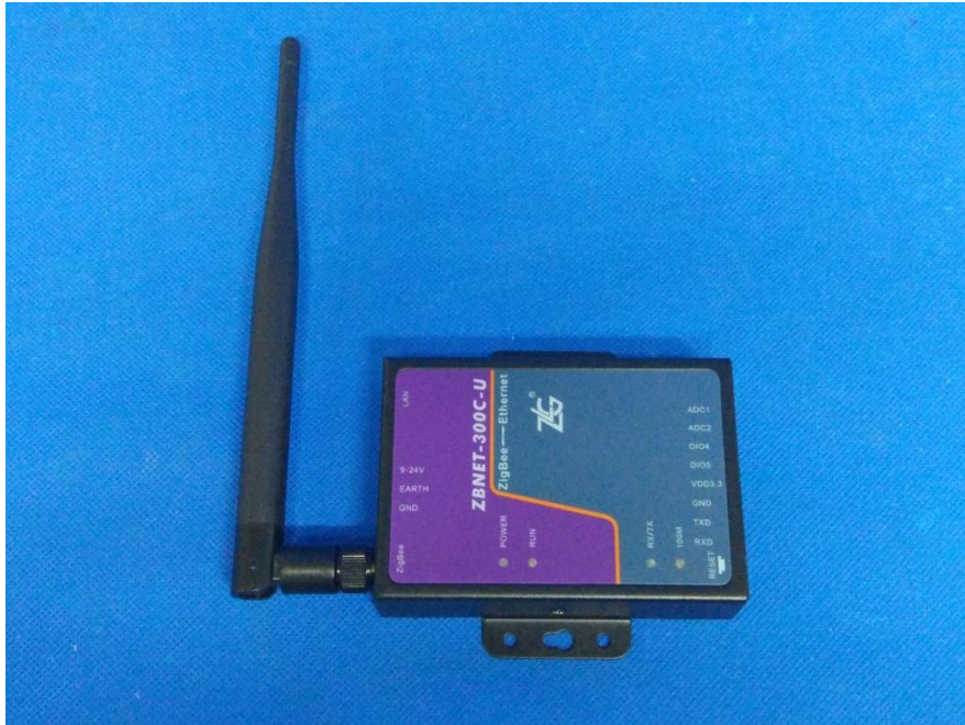
图 1 受试产品正视图