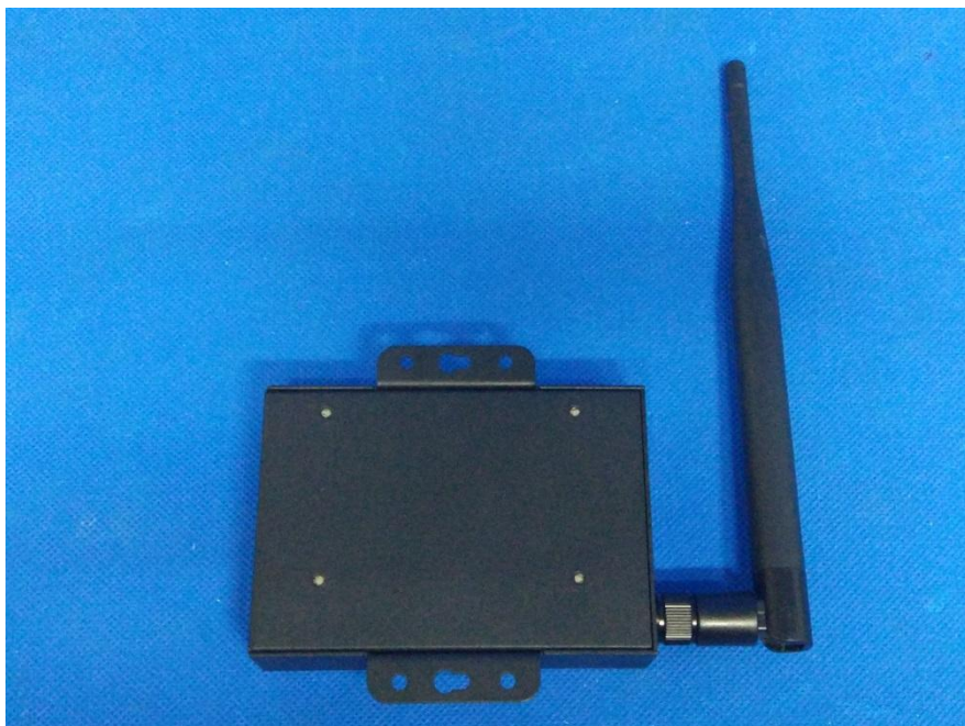
图 2 受试产品后视图