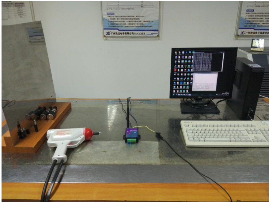
图 3 ESD 试验配置